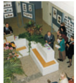
„Mädchen machen Nägel mit Köpf(ch)en“ – Ausstellungseröffnung