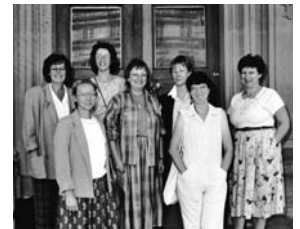
„Gleichstellungskommission hat Rücktritt erklärt“ – Offenburger Tageblatt vom 22. 10. 1988